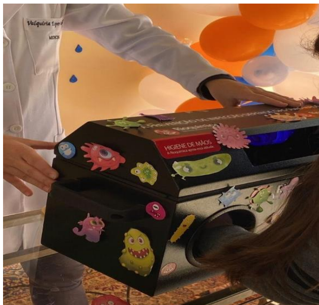
Figura 4 Caixas pretas utilizadas para ensinar a técnica correta da lavagem das mãos, através do uso do protetor para as mãos que contém a substância luminol.