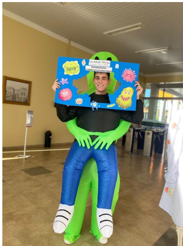
Figura 2 – Dr. Bactéria