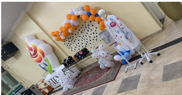
Figura 1. Cenário do Projeto no dia da realização na Faculdade

Assim foi montado um cenário para aplicação da técnica conforme visto na figura 1. Além disso um acadêmico usou um adereço representando uma bactéria com objetivo de atrair atenção do público circulante no local conforme visto na figura 2;