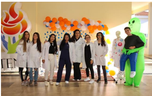
Figura 6 Alunos da Faculdade de Medicina Atenas Passos na realização do Projeto.