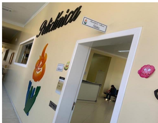
Figura 3 Extensão do projeto da entrada da Faculdade para a Policlínica Atenas Passos