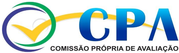
Figura 1 – Avaliações CPA: Indicadores de Qualidade – Curso Medicina