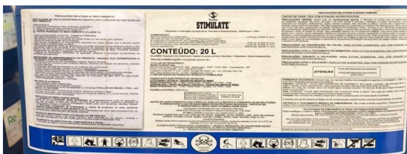
Figura 2- Bioestimulante Stimulate

Stimulate® é um bioestimulante vegetal da Stoller do Brasil Ltda, composto por um conjunto de reguladores vegetais que trazem equilíbrio hormonal, trazendo criação plantas mais eficientes que aproveitem melhor o meio ambiente e seu potencial genético, contribui para maior lucratividade e produtividade. Este bioestimulante proporciona composição de três hormônios: cinetina, ácido giberélico e ácido 4-indol-3-ilbutírico.