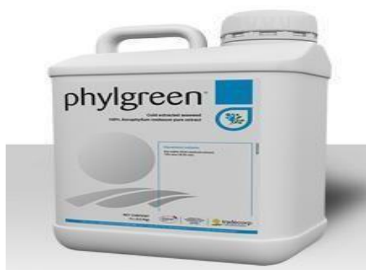
Figura 3- Bioestimulante Phylgreen Gemma