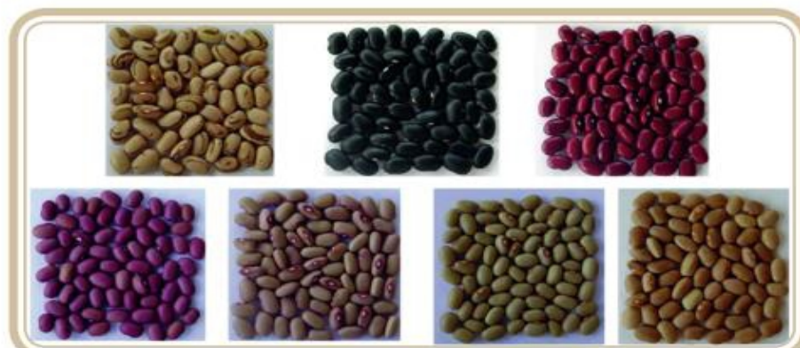
Figura 2- Diferentes tipos de grãos de feijão. Acima da esquerda para a direita: carioca, preto e vermelho. Embaixo, da esquerda para a direita: roxo (roxinho), rosinha, ourinho (bico-de-ouro) e mulatinho.

se até cerca de 30 dias, dependendo estado nutricional e fitossanitário das plantas (SILVA, 2021).