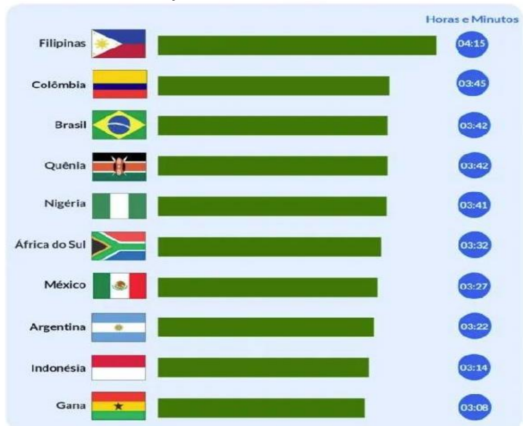
FIGURA 2 – Classificação do Brasil diante ao acesso a internet