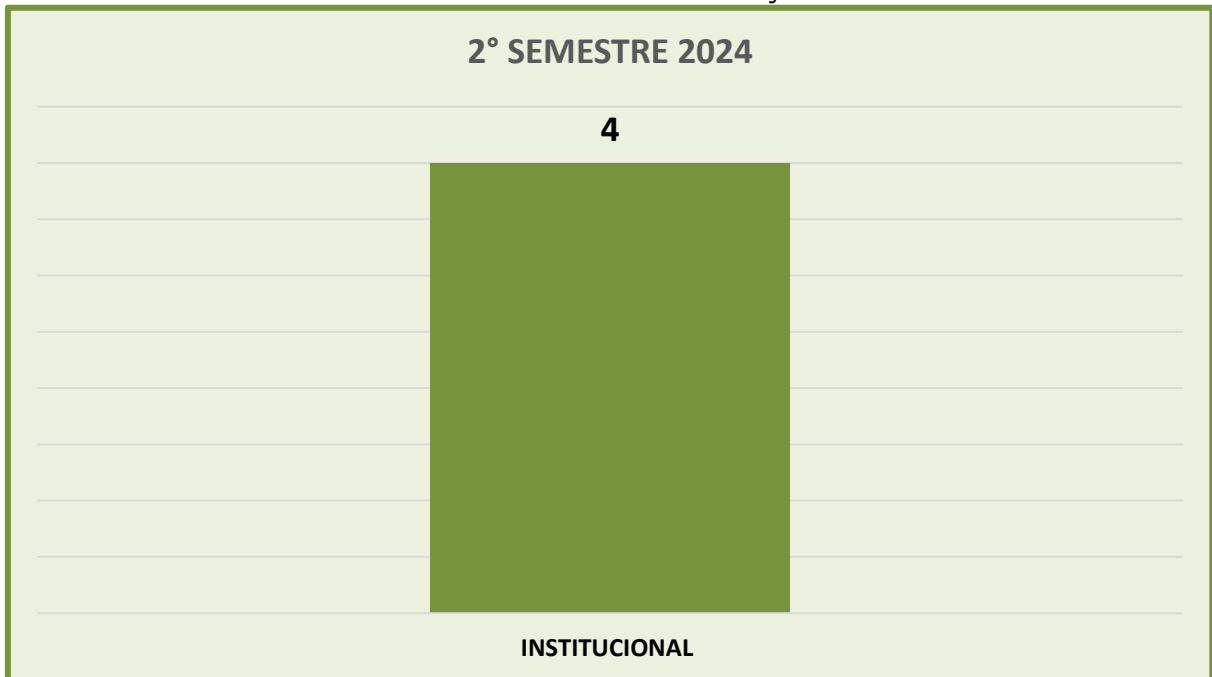
GRAFICO 2 – Conceito de acordo com o nível de satisfação