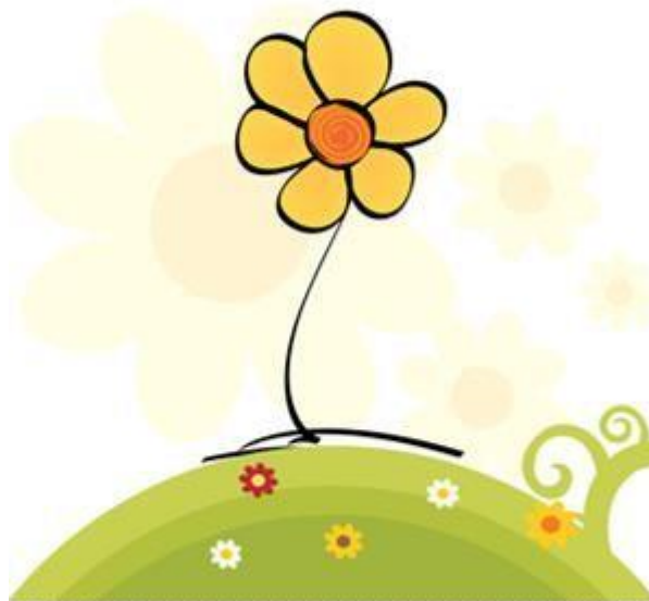
Figura 1- Símbolo da Campanha Faça bonito